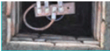
الف - جاء ارت

سایق در پستها، از وصل به هادی حفاظتی ارت، معاف خواهد بود.