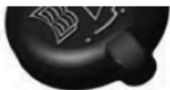
شکل ۸-۴ - در رادیاتور