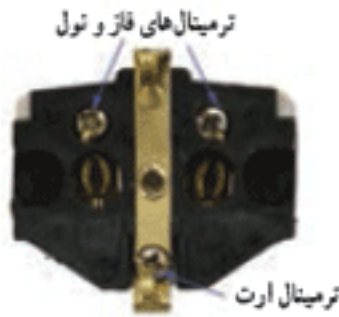
شکل ۱۲-۵ - استفاده از اتصال ارت