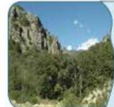
عَيْنُ بیستون غَابَةُ مَدِينَةِ مینودشت